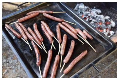
シカ肉のソーセージ 20周年にて